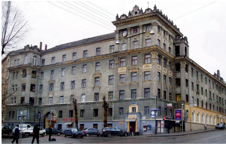
■ Типову будівлю у стилі сталінського ампіру вирізняє фігурний аттик, що нагадує львівські ренесансні кам'яниці.

Прокурори Галицької окружної прокуратури міста Львова вимагають у суді скасування рішень Львівської міської ради. Мерія дала дозвіл на реконструкцію з надбудовою на одній із вулиць міста (вул. Городоцька, 85), йдеться у повідомленні Львівської обласної прокуратури.